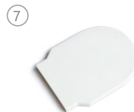
7 Крышка удл. кронштейна 45 для монт. профиля СК 310558-0225