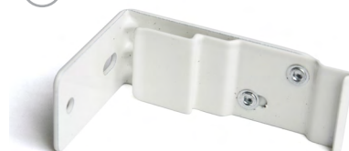
Кронштейн стеновой кассеты 45 СК 310549-0225