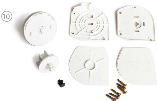
10 Механизм упр. цепь кассеты 45, правый (комплект) 310517-0225