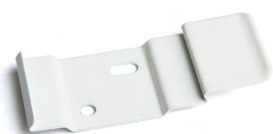
Кронштейн потолочный кассеты 45 СК 310548-0225