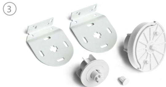
3 Механизм упр.45 для монтажного профиля(комплект) СК 310702-0225