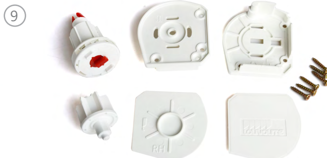
9 Механизм упр. цепь кассеты 32+, левый (комп) 310520-0225