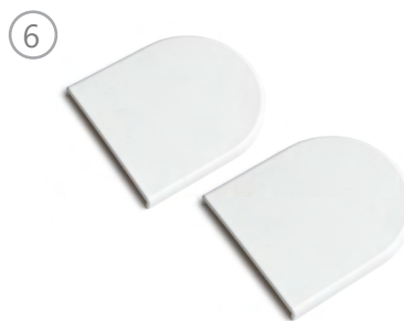
6 Крышка кронштейна 45 (пара), белая СК 310552-0225