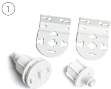
1 Механизм упр. цепь 32 (комплект), универсальный СК 310701-0225