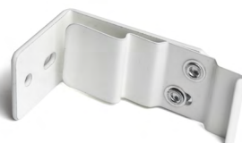
Кронштейн стеновой кассеты 32 СК 310547-0225