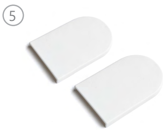
5 Крышка удл. кронштейна 32 для монт.профиля,пара СК 310711-0225