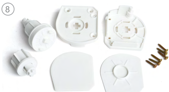
8 Механизм упр. цепь кассеты 32, правый (комп) СК 310731-0225