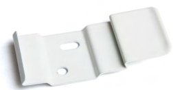
Кронштейн потолочный кассеты 32 СК 310546-0225