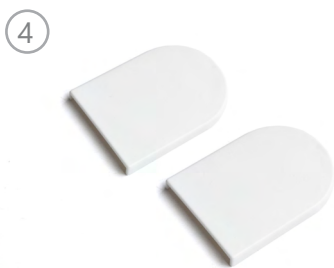
4 Крышка кронштейна 32 (пара), белая СК 310710-0225