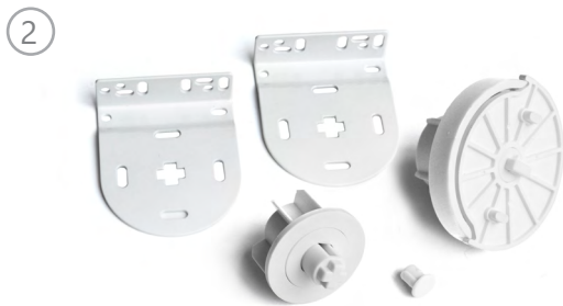
2 Механизм упр. цепь 45 (комплект) СК 310594-0225